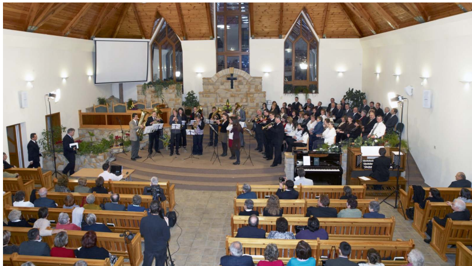
Kezdődik a MABAVISZ vasárnapi istentisztelet a váci imaházban.

3. Az utóbbi két évtizedben megnőtt a lelkipásztorok száma, jelenleg